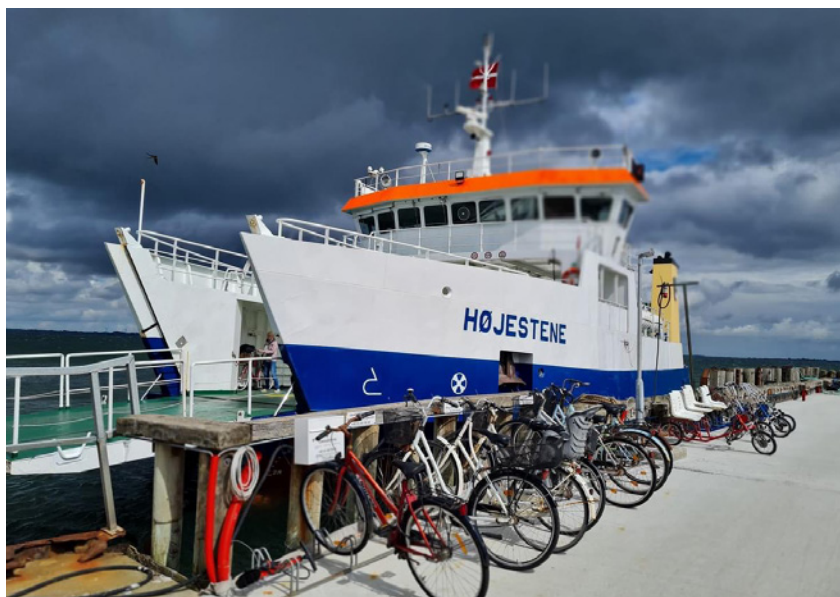
Færgen "Højestene" som sejler fra Svendborg til Skarø og Drejø.

ne med at genopbygge husene. 1 år hinanden, selv om 2. verdenskrig var efter var det meste bygget op igen. i gang. Fantastisk som man kunne hjælpe