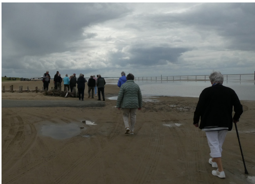
Strandtur på Rømø.