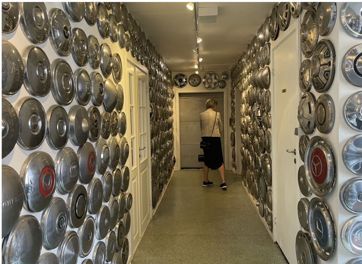
Der kigges på de mange navkapsler.

Det hele bliver vist frem i små butikker, værksteder, et posthus, en byrådsal og en skolestue m.m. Et større rum indeholder f.eks. næsten 5.000 forskellige ølflasker og en hal er fyldt med gamle køretøjer, herunder en samling af flere hundrede navkapsler, som en "vejmand" igennem årene har samlet langs vejstrækninger på Møn.