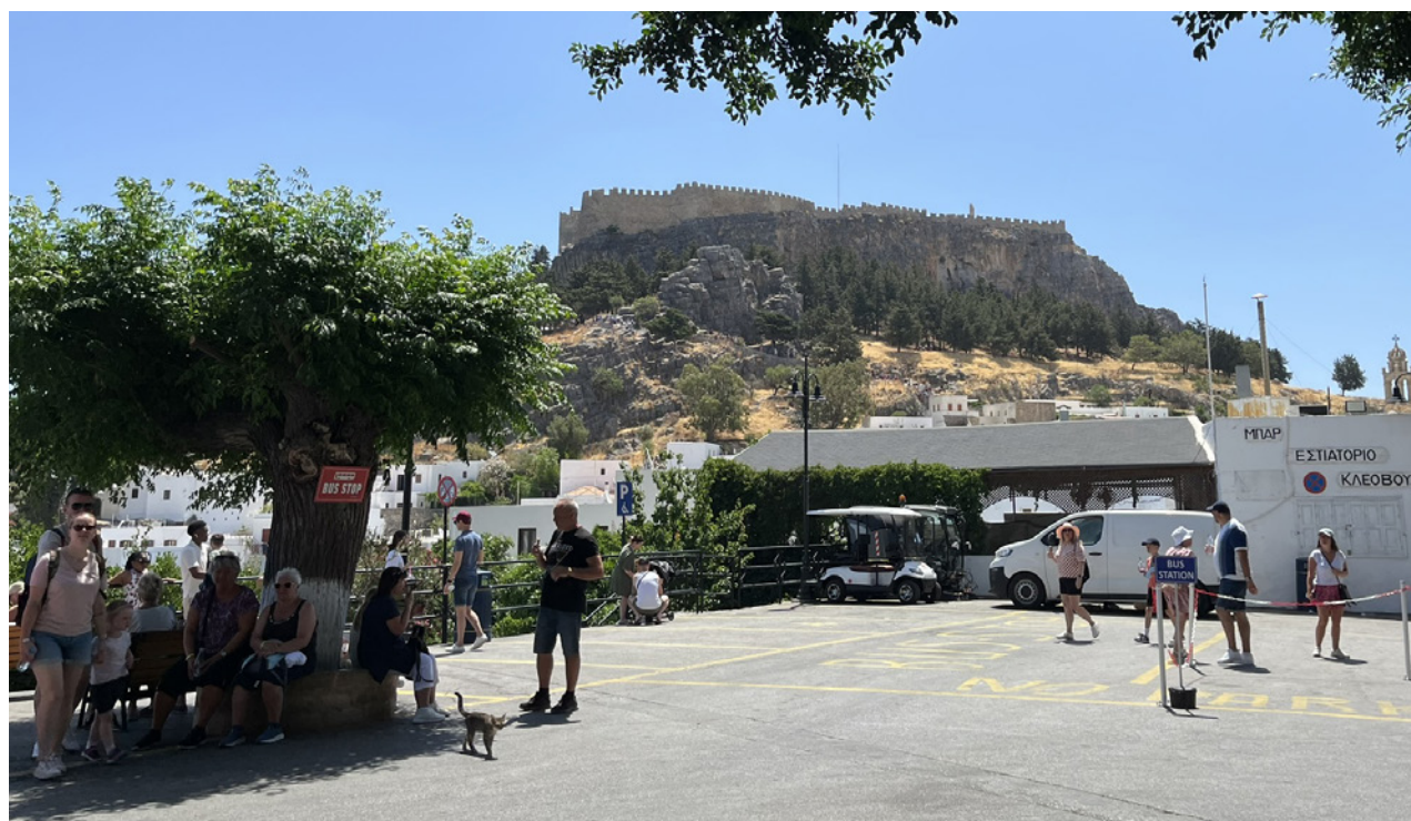
Fra en tur rundt på øen.