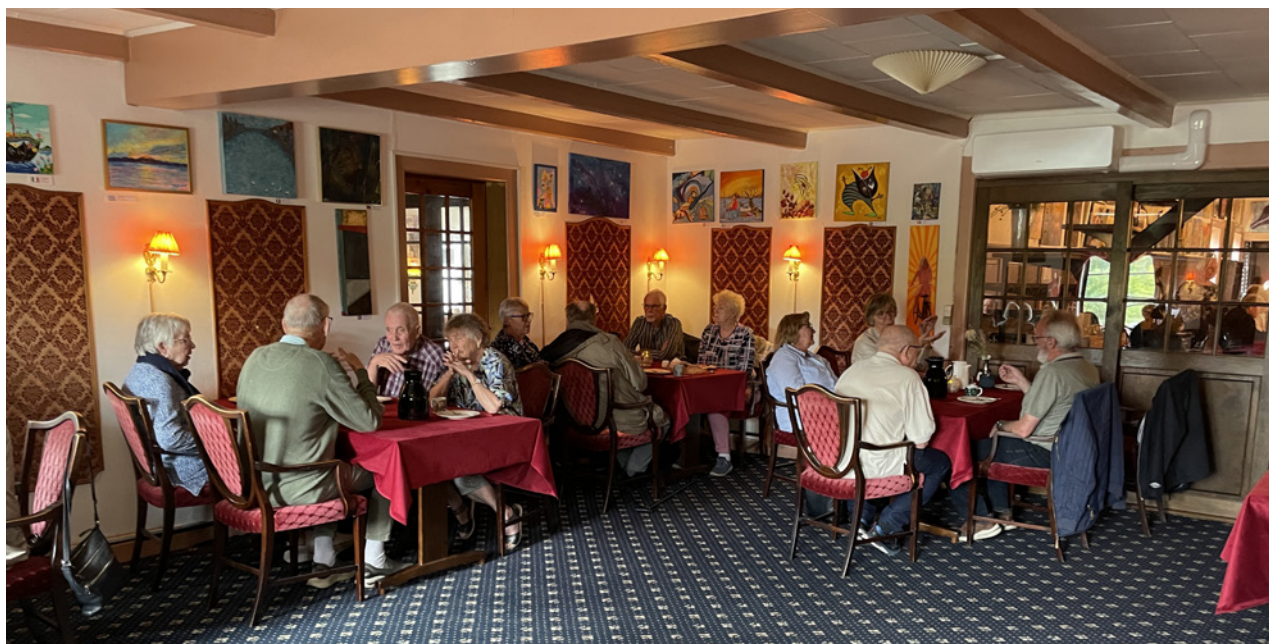
Deltagerne drikker eftermiddagskaffe på Udby Kro.