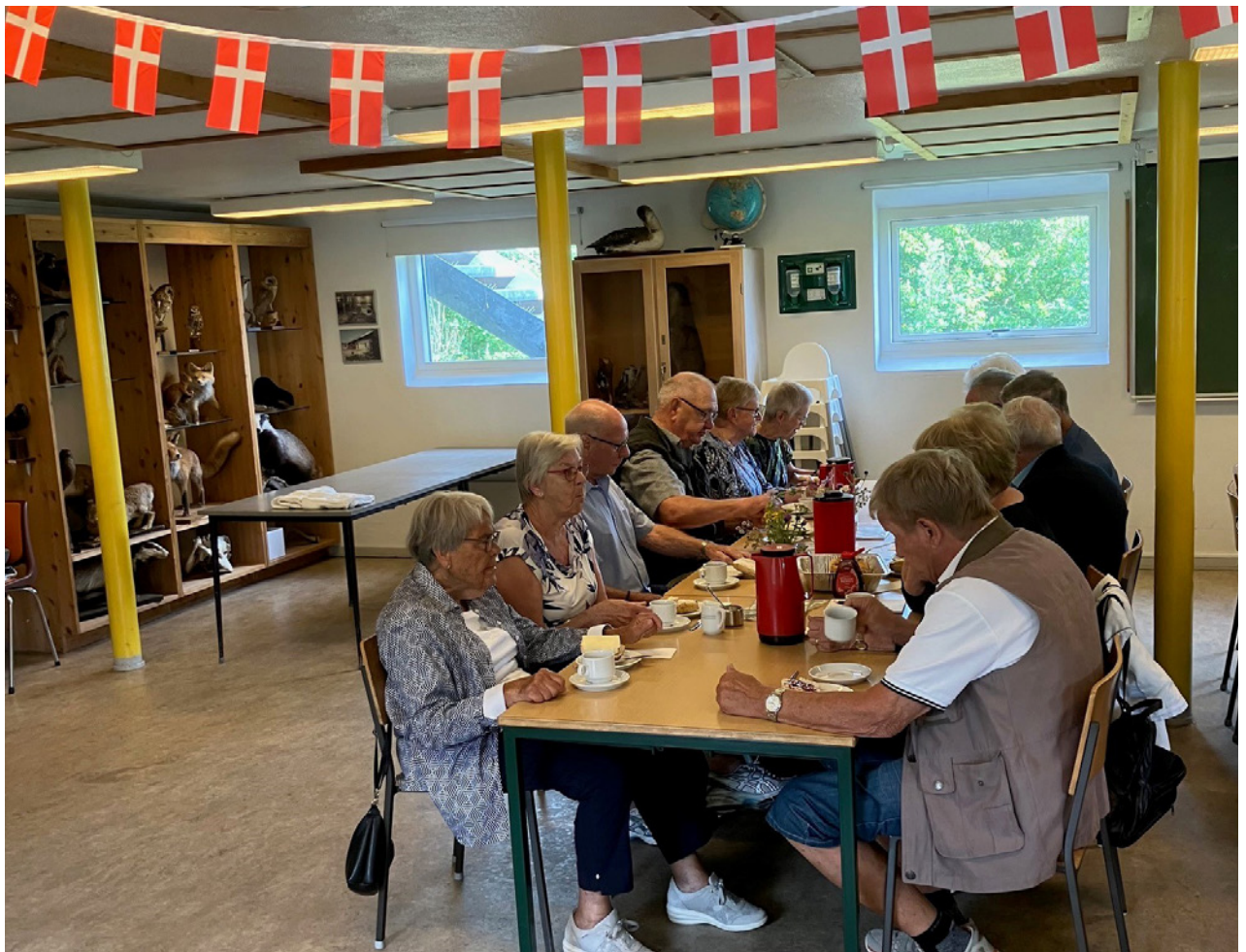
Der snakkes og hygges ved formiddagskaffen.

Medlemstallet er nu på 50. Bestyrelsen arbejder på at opsøge tidligere kollegaer og opfordrede de fremmødte til, at være med til at gøre en indsats for at få nye medlemmer. Der blev samtidig opfordret til at komme med forslag til nye aktiviteter/tiltag.