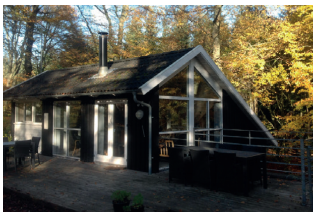
3F's feriehus i Fjellerup.

Alle legater er skattepligtige, og vinderne skal selv angive beløbet på selvangivelsen.