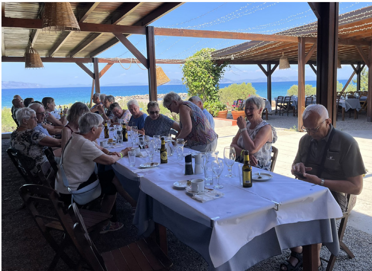
Tørsten slukkes på turen.

Mandag morgen stod vi klar ved bussen kl. 9.00. Vi skulle på byvandring i den gamle del af Rhodos. Vi havde en lokal guide, som talte svensk, med os. Det gik vist meget godt. Efter vores byvandring skulle vi mødes på en re-