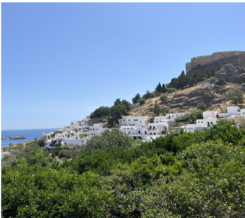
Den hvide by.

Lørdag klokken 10.30 skulle vi være klar med vores kufferter i bussen. Vi var enige om at det havde været