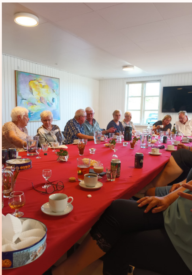
Snakken går lystigt ved kaffebordet.