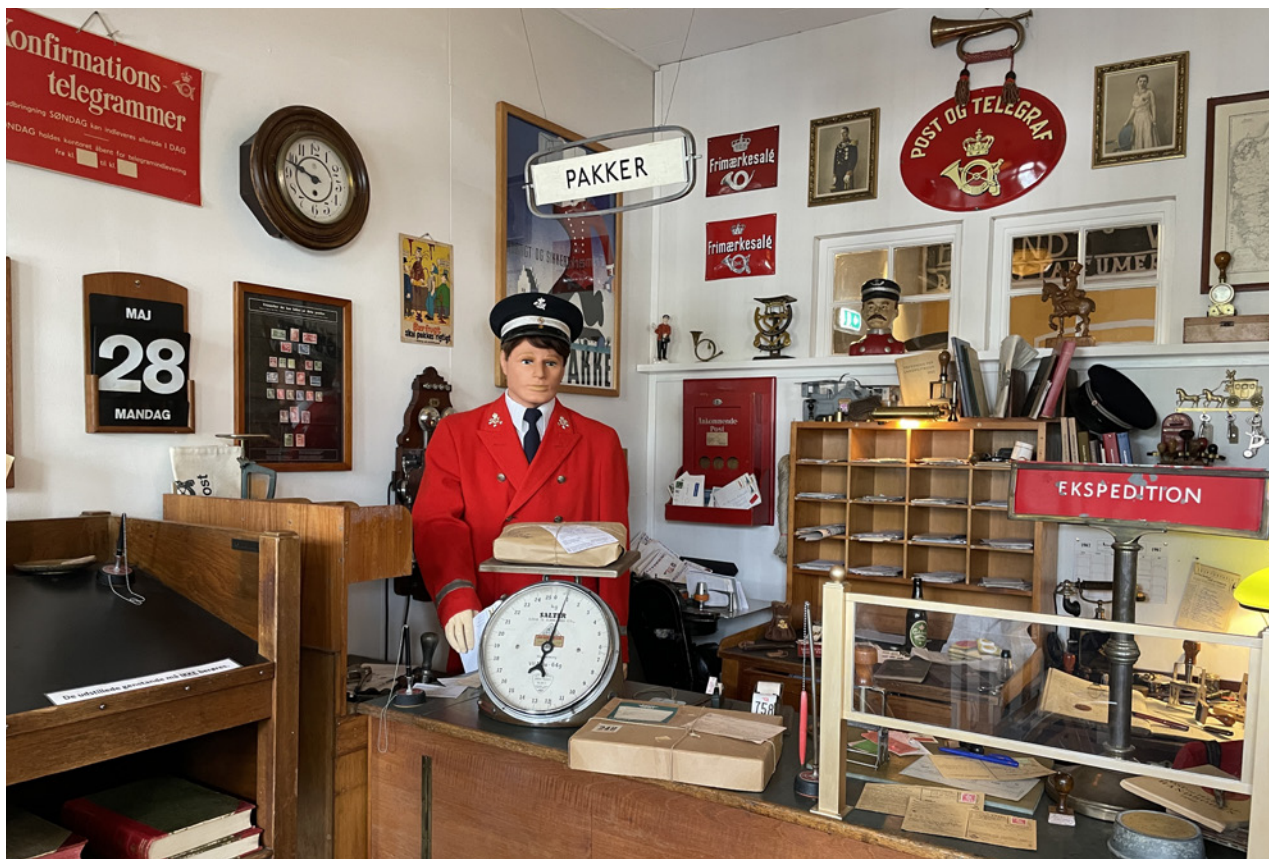
Udstillingen med postbutikken.

Deltagerne fik rig mulighed for at fordybe sig i museets mange rum og genstande – og mon ikke, der i løbet af dagen flere gange blev udbrudt – ”den kan jeg godt huske” eller ”sådan én havde vi hjemme”.