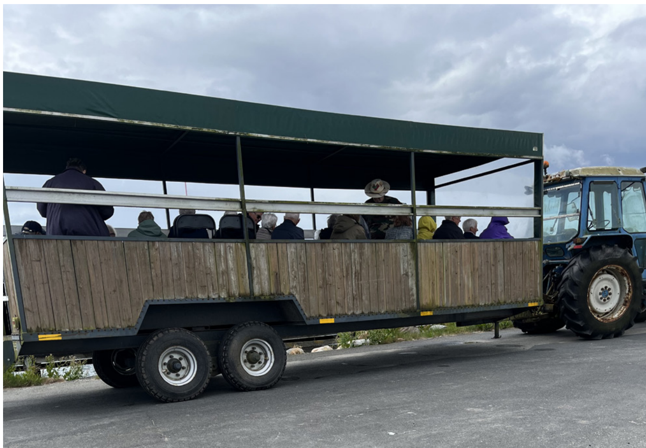
Traktoren med vogn som deltagerne blev fragtet rundt i.

Efter traktorturen kom vi tilbage til byen, hvor der var et egnsmuseum. Der var bl.a. lavet et stort bord med små huse, som nogen havde lavet efter hukommelse og et luftfoto fra 1938. Det var et monument over byen, som det meste af brændte i 1942. To tækkemænd havde banket piber ud i stråene, som så gav ildebranden, der bredte sig til de fleste bygninger. Det fik de en bøde for på 100 kr., men kongen og nogle pengemænd hjalp øboer-