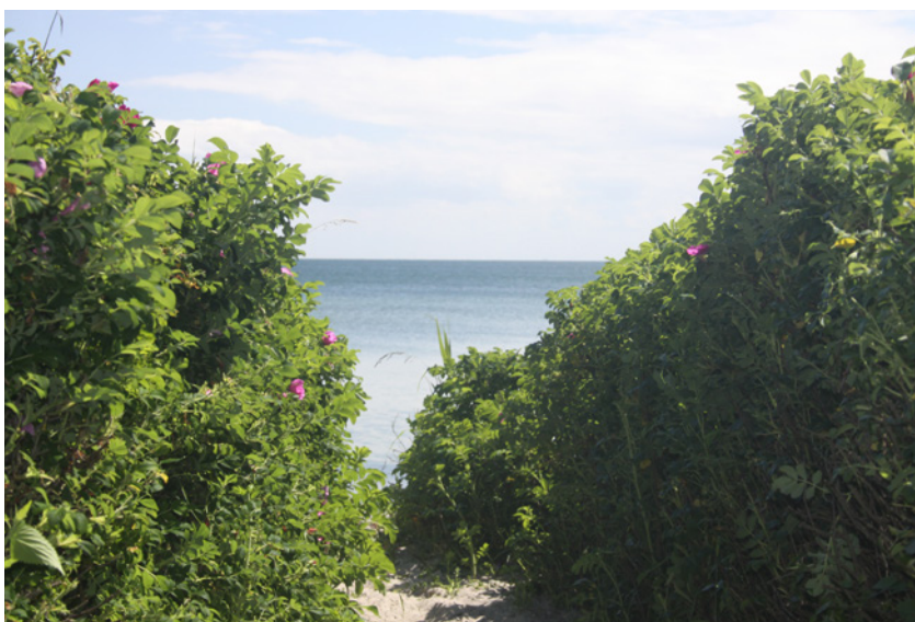
Stien ned til stranden.