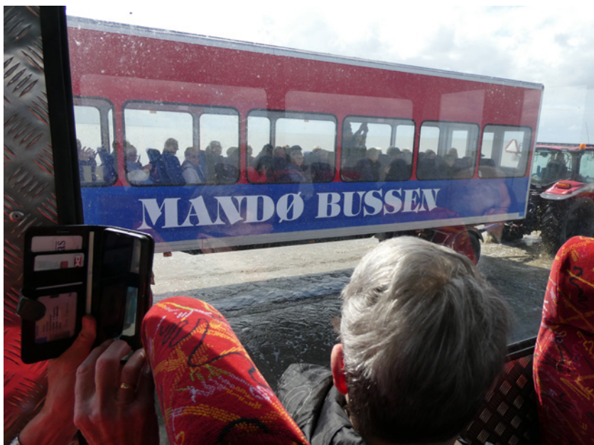
Mandøbussen, der kører fra Vadehavscentret.

4. dagen blev brugt på at få pakket bussen og derefter kørte vi til Haderslev. Først fik vi en guidet tur i Haderslev Domkirke og derefter en lille tur rundt i det gamle Haderslev. Vi endte ved Haderslev Dam, hvor vi steg ombord på Haderslev Dambåd. Det var en dejlig tur, hvor vi fik fortalt om de